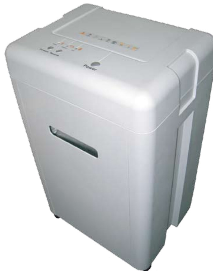
Niszczarka dokumentów i płyt CD